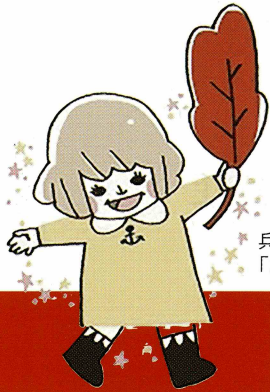
兵庫県共同募金会マスコット 「あかはねちゃん」